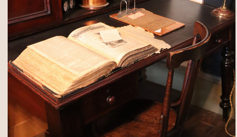
Adresse : 44 Chau. des Écossais.