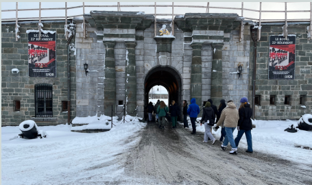
Adresse : 1 Côte de la Citadelle.